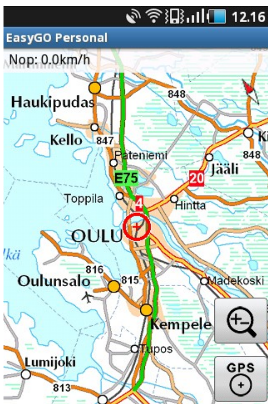
Kuva 1. toiminnot näytöllä

Sovelluksessa käytetään yleisiä Android käyttöliittymään liittyviä toimintoja. Tutustu huolellisesti puhelimesi käyttöohjeeseen ennen sovelluksen täysipainoista käyttöönottoa.