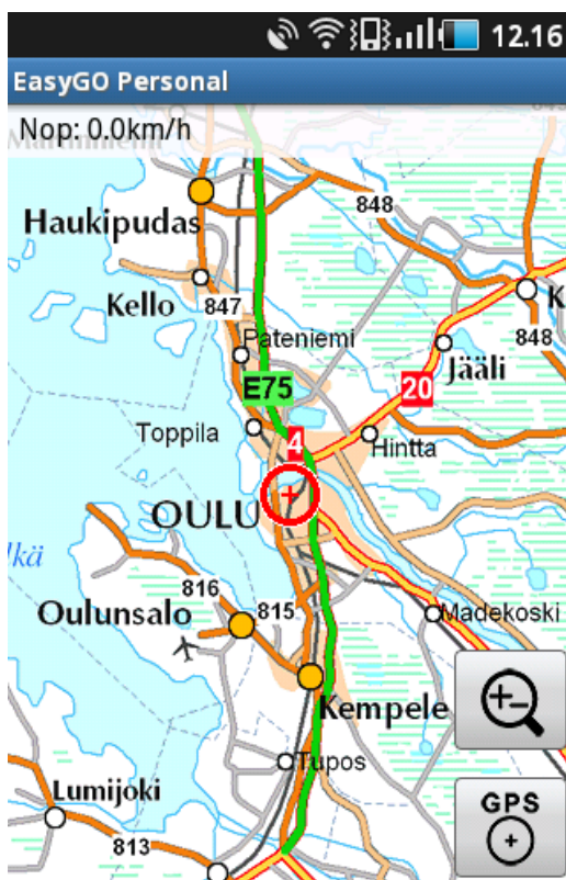
Kuva 1. toiminnot näytöllä

Sovelluksessa käytetään yleisiä Android käyttöliittymään liittyviä toimintoja. Tutustu huolellisesti puhelimesi käyttöohjeeseen ennen sovelluksen täysipainoista käyttöönottoa.