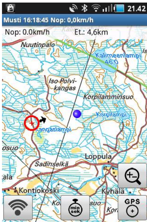
Kuva 1. toiminnot näytöllä

Sovelluksessa käytetään yleisiä Android käyttöliittymään liittyviä toimintoja. Tutustu huolellisesti puhelimesi käyttöohjeeseen ennen sovelluksen täysipainoista käyttöönottoa.